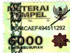
Habib Wakidatul Ihtiar