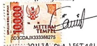
YULIA DWI LESTARI Namaterangdantandatangan

Tulungagung, 6 Agustus 2021 Yang Menyatakan,