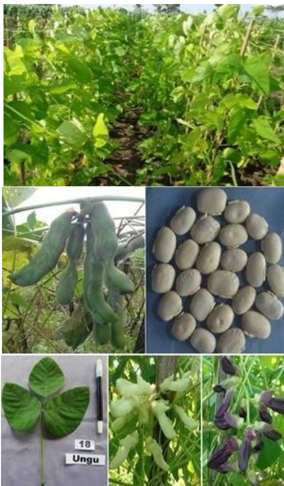
Gambar 2.1 Tanaman Kara Benguk ( Mucuna pruriens L. ) 16

pada polong kacangnya. Setiap polongnya biasanya berukuran panjang 10 – 15 cm dengan lebar 1,5 – 2 cm dan terdapat 4 – 6 biji kara benguk. 15